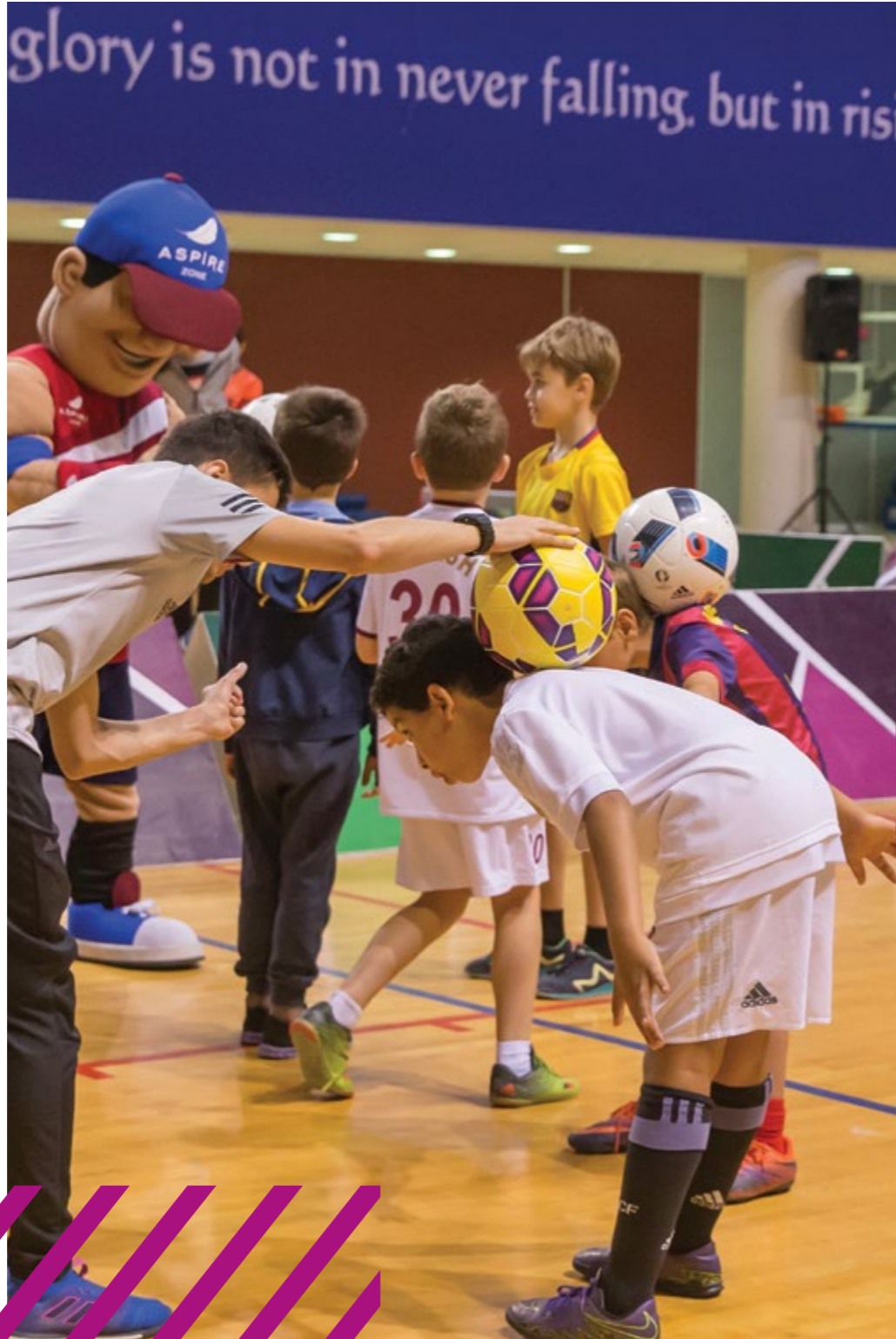
مهارات وفنون كرة القدم قدمها أفضل لاعبي الفرى-ستايل (free-styling) بقية أسباير في فبراير الماضي

Advanced football free-styling by iFreestyle in Aspire Dome last February.