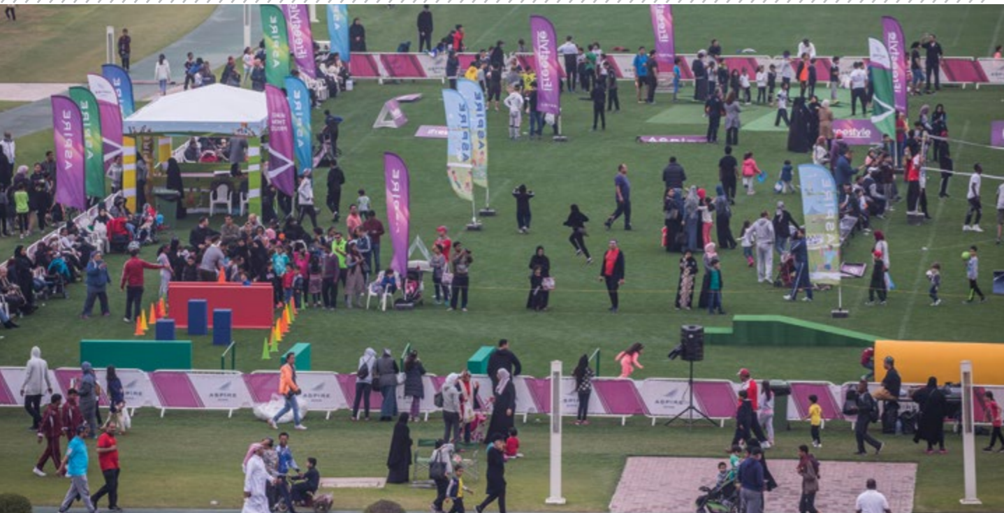
منطقة مخصصة للعائلات لممارسة الرياضة AN AREA DEDICATED TO FAMILIES TO PLAY SPORTS