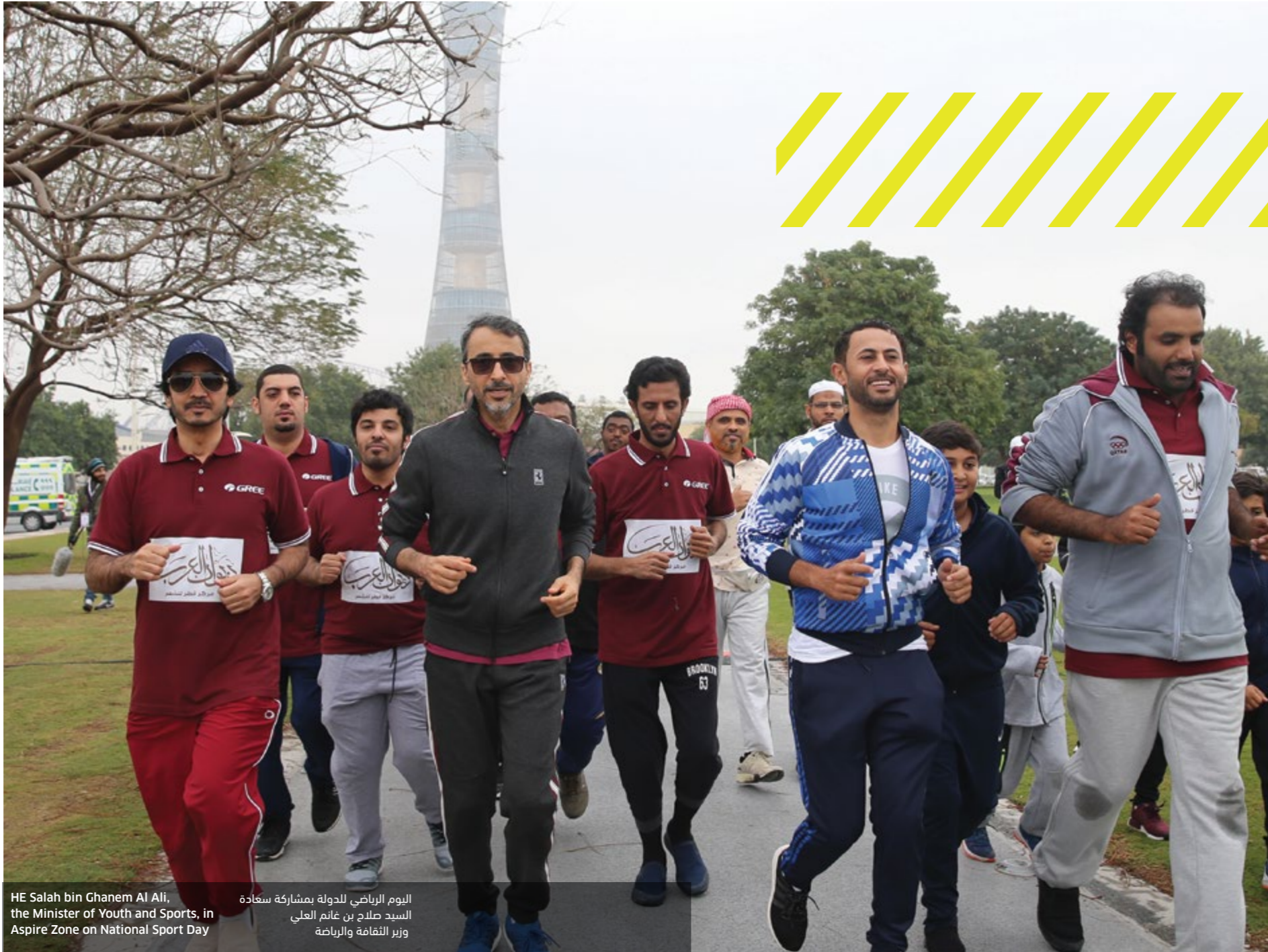
HE Salah bin Ghanem Al Ali, the Minister of Youth and Sports, in Aspire Zone on National Sport Day

اليوم الرياضي للدولة بمشاركة سعادة السيد صلاح بن غانم العلي وزير الثقافة والرياضة