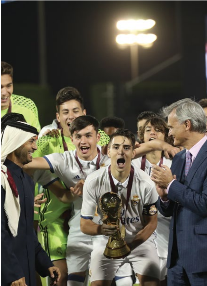
ريال مدريد يتوج بطلا للكاس ٢٠١٧ Real Madrid Crowned Champions of Al Kass 2017

"كان أداء أسباير ممتازاً في الشوط الأول ولقد قاوم اللاعبون بشدة وكان أدائهم قوياً. ولكن أعتقد بأن لعب الفريق الأسباني كان واضحاً في الشوط الثاني. وكان تنظيم البطولة ممتازاً ولقد استمتعت بمشاهدة البطولة."